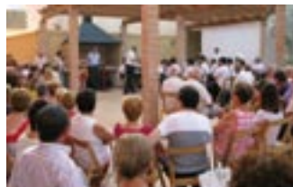
Orxetans reunits en l'homenatge