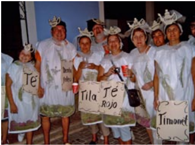
Nit de disfresses