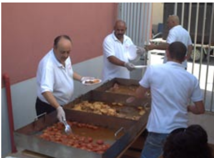
Els cuiners servint el llomello