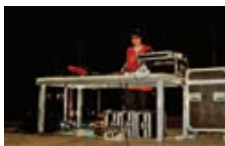
U dels DJ en ple espectacle

13 AGOST. Per segon any consecutiu, l'ajuntament ha organitzat la Festa Remember del 13 de agosto en el pantà Amadori. Es tracta d'una festa "rave" promocionada pel propi Ajuntament i la Comissió