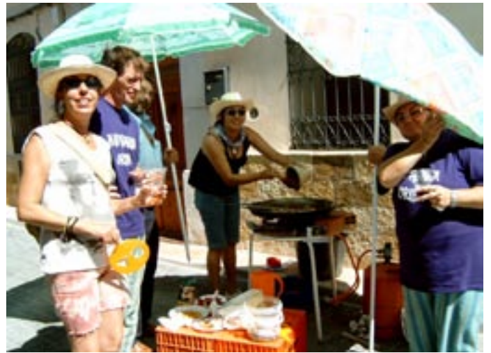
Concurs de paelles