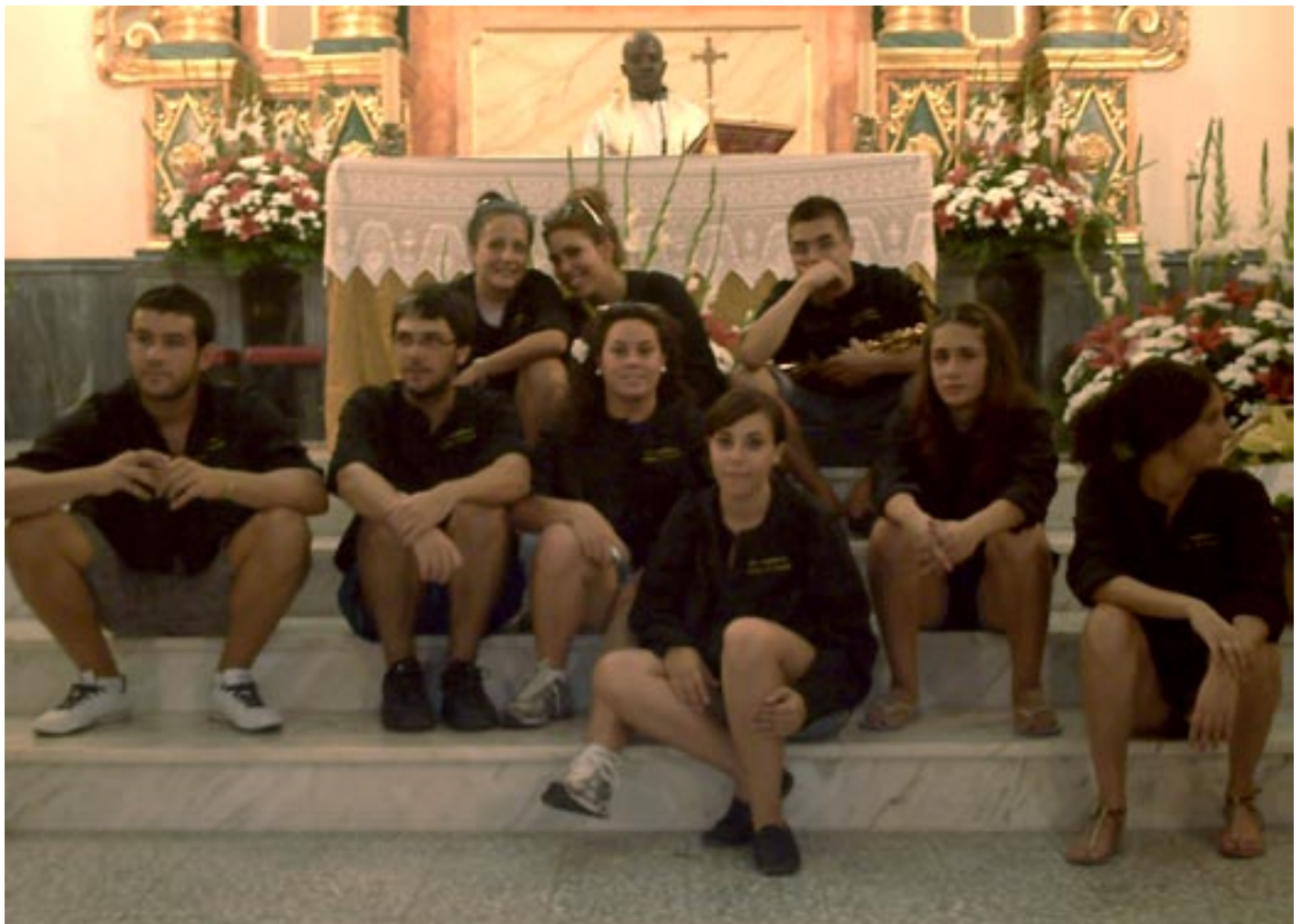
Membres de la penya "El Malfainers" davant de l'altar

Des d'aquestes pàgines, també volem informar que la penya encarregada de realitzar les festes del 2012 és " Els Aspalrats", als quals desitgem molta sort i els oferim tota la nostra ajuda.