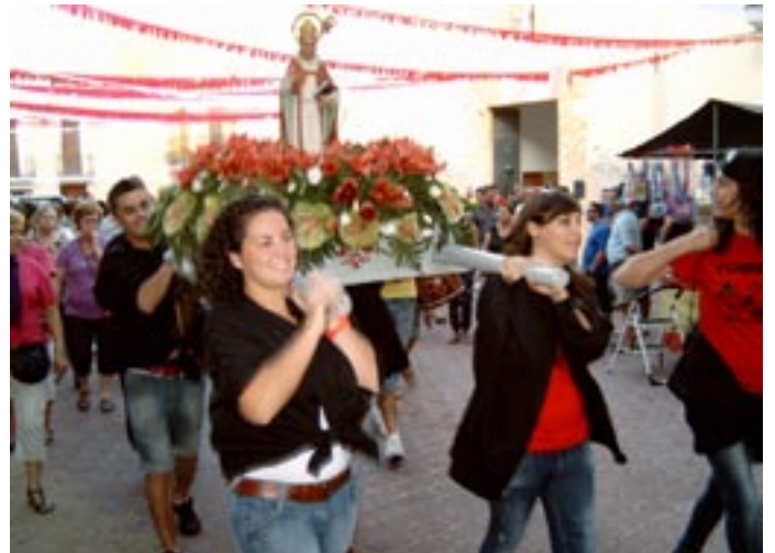
Pujada del Sant