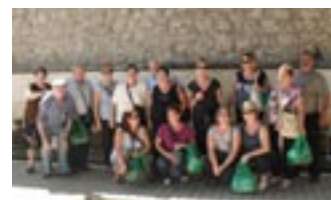
El grup posant enfront d'una de les fonts

El viatge ha tingut una durada de cinc dies (21 al 25 de setembre) i ha estat format per un grup de 20 persones, les quals han pogut gaudir de l'arquitectura àrab que caracteritza la província de Andalusia i la seua millor gastronomia.