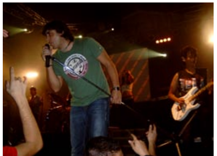
Els conjunts animant la festa

En aquest primer article sabem que hauran errades, demanem disculpes; per això esperem la col·laboració de tot el poble amb els seus suggeriments i imatges que desitgen publicar al butlletí. També volem informar que els pròxims números estaran traduïts al castellà i l'anglès