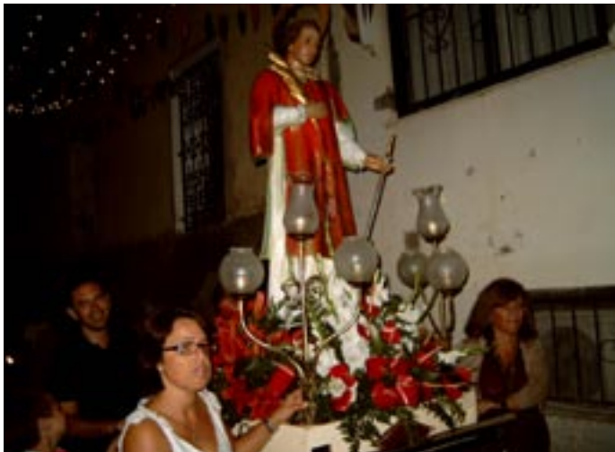
Processo de Sant Nazari